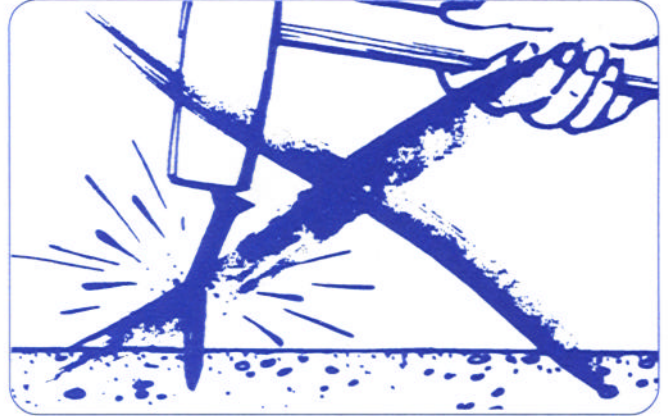
vermeiden Sie solche Unfälle

z. B. geeignet für Befestigung von Latten, Brettern, Schalungshölzern, Putzleisten, Verkleidung usw. auf Bausteinen, Mauerwerk und Beton.